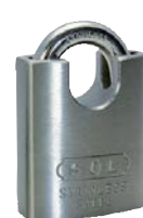
No.8500 パーフェクトロック