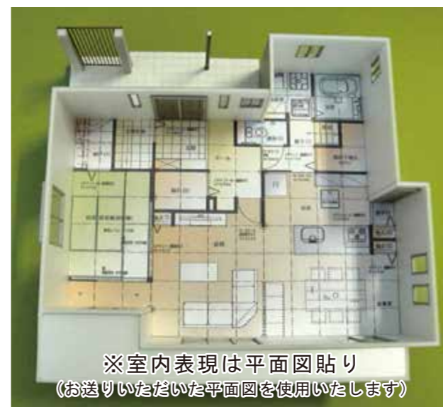
※室内表現は平面図貼り (お送りいただいた平面図を使用いたします)