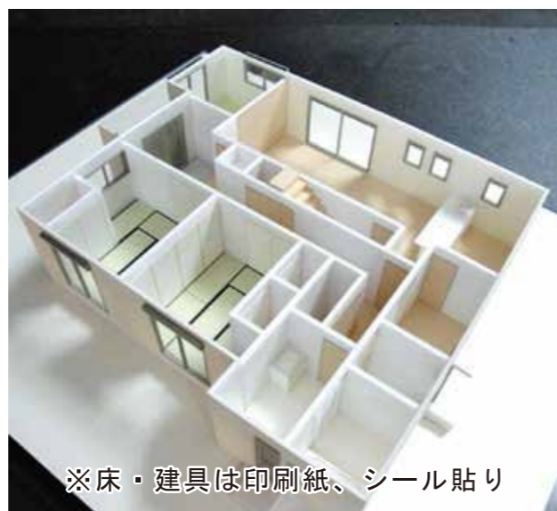
※床・建具は印刷紙、シール貼り