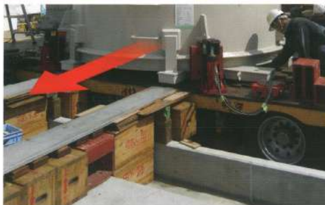
大型タンクの移設(ステージ導線)