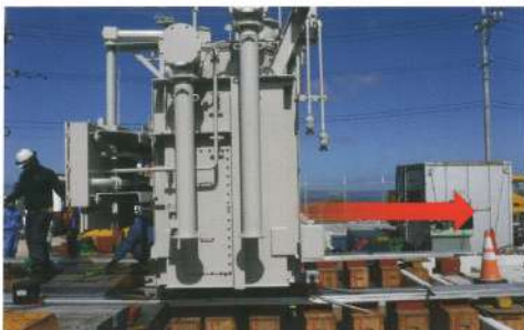
変圧器の移設(ステージ導線)