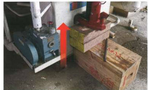
機械ジャッキアップ